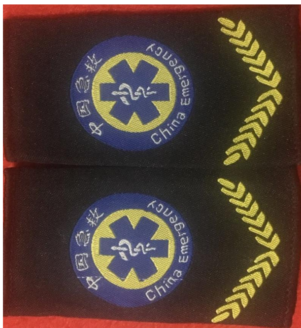
套肩式肩章“韶关急救”，（图片上所显示的文字仅供参考，不予采用）