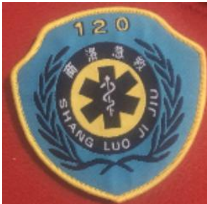
悬挂式臂章“120 韶关急救”，（图片上所显示的文字仅供参考，不予采用。）